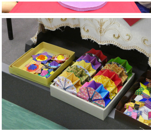
市場で幼児玩具買い付け