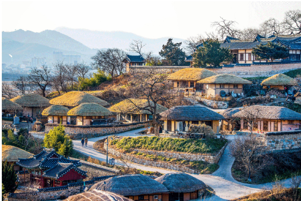
朝鮮王朝時代の文化が今も息づく歴史村