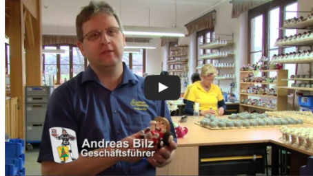
YouTube 画面中央の「▶」を押しますと「音」が出ますのでご注意ください。

ドイツ北東部エルツ山脈の山間にある小さな村ザイフェン。この村に一歩足を踏み入ると、そこにはおもちゃの世界が広がります。この地方は14世紀から錫をはじめ、銀などの採掘業で発展してきましたが、19世紀半ば鉱山の衰退に伴い木工業、特に木のおもちゃ作りが盛んになりました。村のほとんどの人が、何らかの形でおもちゃ作りに従事しているザイフェンでは、身近な生活の営みや願い、そして歴史を大切にする心が、おもちゃを通じて表現されています。そうしたザイフェンのおもちゃをカテゴリーに分けてご紹介します。